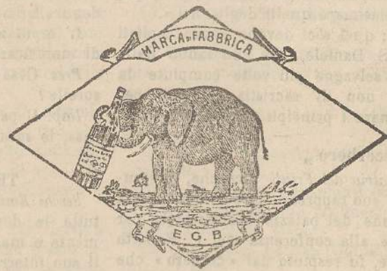
Marca speciale depositata.

Valenti autorità mediche lo dichiarano il più efficace ed il migliore ricostituente tonico digestivo dei preparati consimili, perchè la presenza del RABARBARO, oltre d'attivare una buona digestione, impedisce anche la stitichezza originata dal solo FERRO-CHINA.