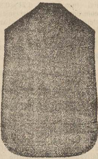
Pianeta Dam. seta L. 24 Ton'celle > 48 Piviale > 50

Deposito e confezione Arredi sacri -- Fondata nel 1882 -- Filati oro e argento fino per ricamo 900/1000