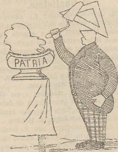
La nomina di Theodor — Questa è pagpa nostra.