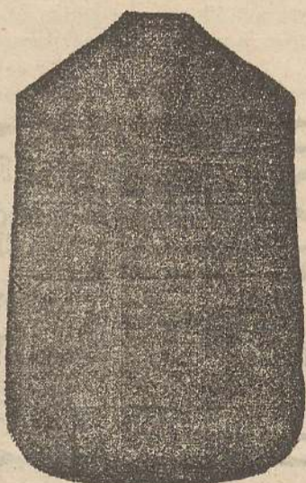
Pianeta Dam. seta L. 24 Tonicelle > 48 Piviale > 50

Deposito e confezione Arredi sacri - Fondata nel 1882 - Filati oro e argento fino per ricamo 900/000