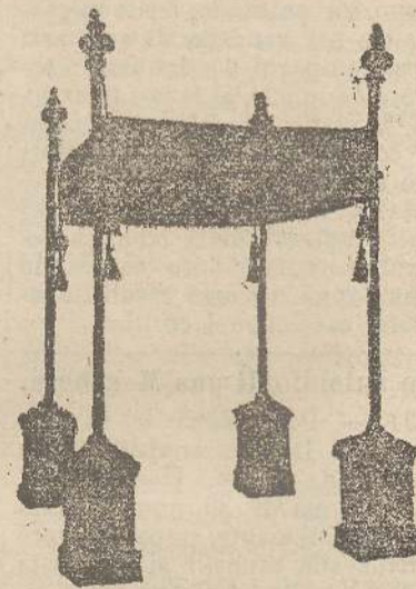
Baldacchini in Damasco seta con aste da L. 155, 200, 300, 350, 400 in più.

Apparamenti completi, Pianete, Stole, Veli Omerali, Abiti da Vergine, Veli ricamati, sul Thùl in seta e oro, Copripisside, Ombrelle per Viatico, Stratti mortuari, Parapetti altare, Tappeti per coro, Padiglioni per altare in seta, bourlette e cotone, Cingoli, Merli candidi per camici e cotte, Colonnami seta in tutte le altezze, Broccati, Damaschi, Grisette, Frangie, Galloni, Tocche, Stelle, fiocchi oro, seta e argento, Cordoni, Tele filo Rosa per confraternite.