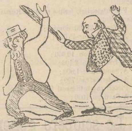
Alla Camera. Fortis risponde in modo persuasivo all'on. Ferri.