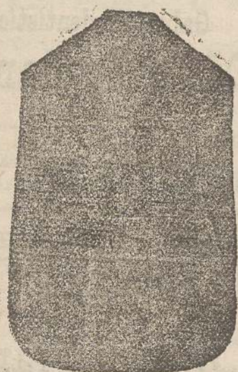
Pianeta Dam. seta L. 24 Tonicelle > 45 Piviale > 50

Premiato con medaglia d'oro all'Esposizione Regionale di Udine 1903 Deposito e confezione Arredi sacri -- Fondata nel 1882 -- Filati oro e argento fino per ricamo 900/1000