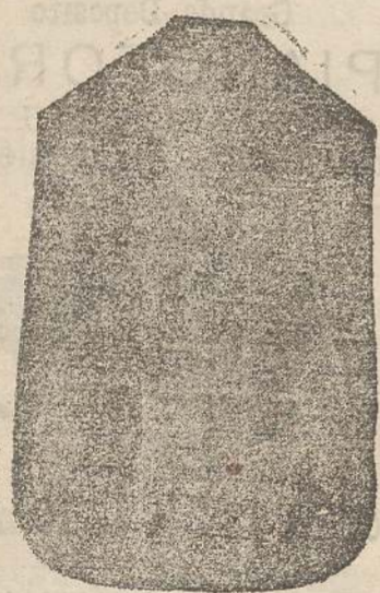
Pianeta Dam. seta L. 24 > 45 Tonicelle > 48 Piviale > 50

Premiato con medaglia d'oro all'Esposizione Regionale di Udine 1903 Deposito e confezione Arredi sacri -- Fondata nel 1882 -- Filati oro e argento fino per ricamo 900/000