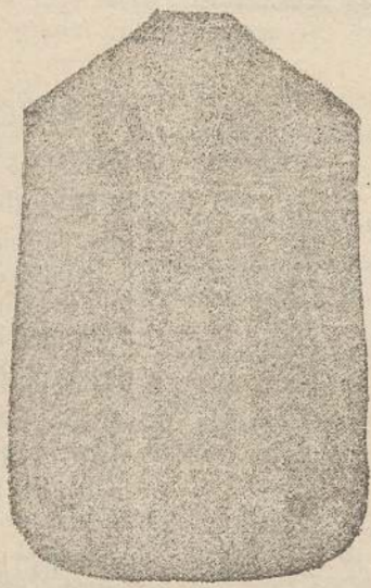
Paneta Dam. seta L. 24 Tonicelle > 48 Piviale > 50

Deposito e confezione Arredi sacri -- Fondata nel 1882 -- Filati oro e argento fino per ricamo 900/1000