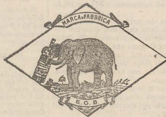
Marca speciale depositata.

Valenti autorità mediche lo dichiarano il più efficace ed il migliore ricostituente tonico digestivo dei preparati consimili, perchè la presenza del RABARBARO, oltre d'attivare una buona digestione, impedisce anche la stitichezza originata dal solo FERRO-CHINA.