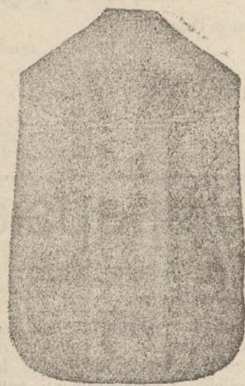
Pianeta Dam. seta L. 24 Tonicelle > 48 Piviale > 50

Premiato con medaglia d'oro all'Esposizione Regionale di Udine 1903 Deposito e confezione Arredi sacri -- Fondata nel 1882 -- Filati oro e argento fino per ricamo 900/1000