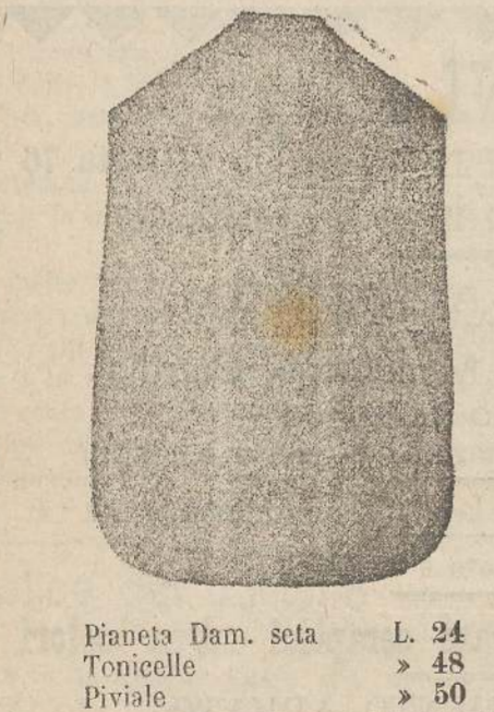
Pianeta Dam. seta L. 24 Tonicelle > 48 Piviale > 50

Premiato con medaglia d'oro all'Esposizione Regionale di Udine 1903 Deposito e confezione Arredi sacri -- Fondata nel 1882 -- Filati oro e argento fino per ricamo 900/1000