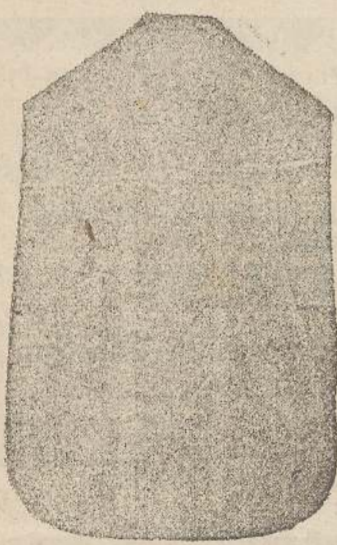
Pianeta Dam. seta L. 24 Tonicelle > 48 Piviale > 50

Deposito e confezione Arredi sacri -- Fondata nel 1882 -- Filati oro e argento fino per ricamo 900/1000