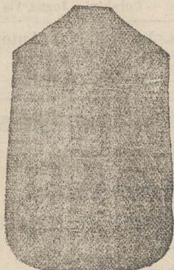
Pianeta Dam. seta L. 24 Tonicelle > 48 Piviale > 50

Deposito e confezione Arredi sacri -- Fondata nel 1882 -- Filati oro e argento fino per ricamo 900/1000