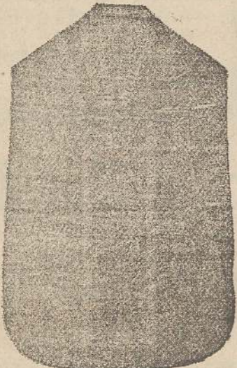
Pianeta Dam. seta L. 24 Tonicelle > 48 Piviale > 50

Deposito e confezione Arredi sacri -- Fondata nel 1882 -- Filati oro e argento fino per ricamo 900/1000