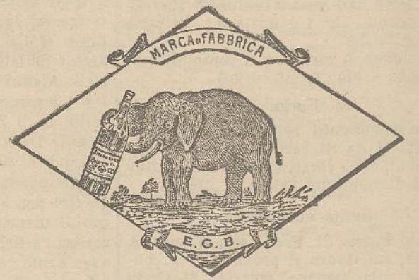
Marca speciale depositata.

Valenti autorità mediche lo dichiarano il più efficace ed il migliore ricostituente tonico digestivo dei preparati consimili, perchè la presenza del RABARBARO, oltre d'attivare una buona digestione, impedisce anche la stitichezza originata dal solo FERRO-CHINA.