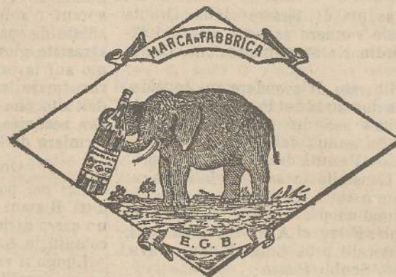
Marca speciale depositata.

Valenti autorità mediche lo dichiarano il più efficace ed il migliore ricostituente tonico digestivo dei preparati consimili, perchè la presenza del RABARBARO, oltre d'attivare una buona digestione, impedisce anche la stitichezza originata dal solo FERRO-CHINA.