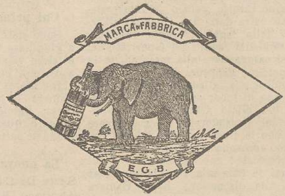
Marca speciale depositata.

Valenti autorità mediche lo dichiarano il più efficace ed il migliore ricostituente tonico digestivo dei preparati consimili, perchè la presenza del RABARBARO, oltre d'attivare una buona digestione, impedisce anche la stitichezza originata dal solo FERRO-CHINA.