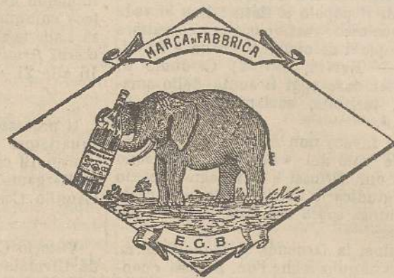
Marca speciale depositata.

Valenti autorità mediche lo dichiarano il più efficace ed il migliore ricostituente tonico digestivo dei preparati consimili, perchè la presenza del RABARBARO, oltre d'attivare una buona digestione, impedisce anche la stitichezza originata dal solo FERRO-CHINA.