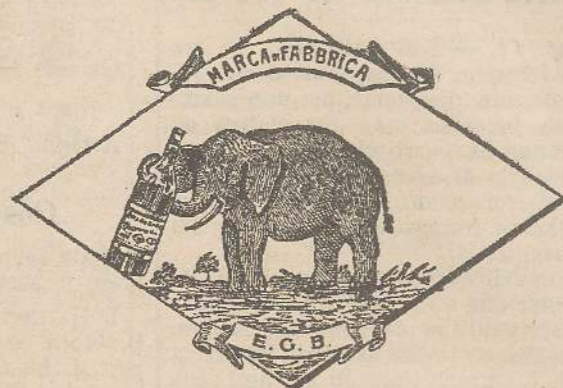
Marca speciale depositata.

Valenti autorità mediche lo dichiarano il più efficace ed il migliore ricostituente tonico digestivo dei preparati consimili, perchè la presenza del RABARBARO, oltre d'attivare una buona digestione, impedisce anche la stitichezza originata dal solo FERRO-CHINA.