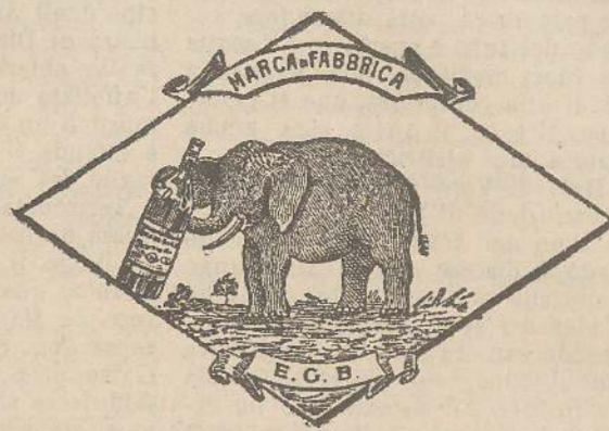
Marca speciale depositata.

Valenti autorità mediche lo dichiarano il più efficace ed il migliore ricostituente tonico digestivo dei preparati consimili, perchè la presenza del RABARBARO, oltre d'attivare una buona digestione, impedisce anche la stitichezza originata dal solo FERRO-CHINA.