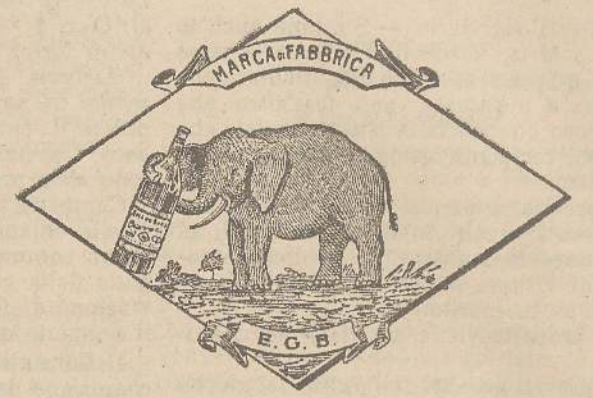
Marca speciale depositata.

Valenti autorità mediche lo dichiarano il più efficace ed il migliore ricostituente tonico digestivo dei preparati consimili, perchè la presenza del RABARBARO, oltre d'attivare una buona digestione, impedisce anche la stitichezza originata dal solo FERRO-CHINA.