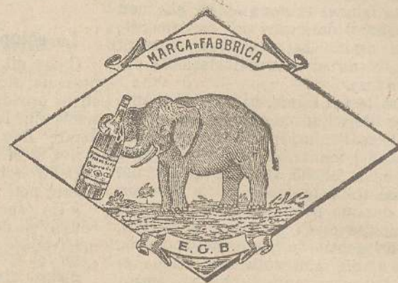
Marca speciale depositata.

Valenti autorità mediche lo dichiarano il più efficace ed il migliore ricostituente tonico digestivo dei preparati consimili, perchè la presenza del RABARBARO, oltre d'attivare una buona digestione, impedisce anche la stitichezza originata dal solo FERRO-CHINA.