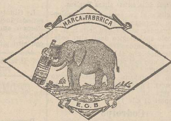
Marca speciale depositata.

Valenti autorità mediche lo dichiarano il più efficace ed il migliore ricostituente tonico digestivo dei preparati consimili, perchè la presenza del RABARBARO, oltre d'attivare una buona digestione, impedisce anche la stitichezza originata dal solo FERRO-CHINA.