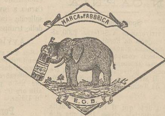
Marca speciale depositata.

Valenti autorità mediche lo dichiarano il più efficace ed il migliore ricostituente tonico digestivo dei preparati consimili, perchè la presenza del RABARBARO, oltre d'attivare una buona digestione, impedisce anche la stitichezza originata dal solo FERRO-CHINA.