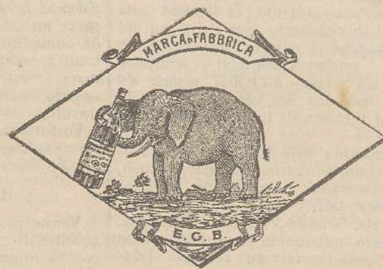
Marca speciale depositata.

Valenti autorità mediche lo dichiarano il più efficace ed il migliore ricostituente tonico digestivo dei preparati consimili, perchè la presenza del RABARBARO, oltre d'attivare una buona digestione, impedisce anche la stitichezza originata dal solo FERRO-CHINA.