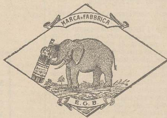
Marca speciale depositata.