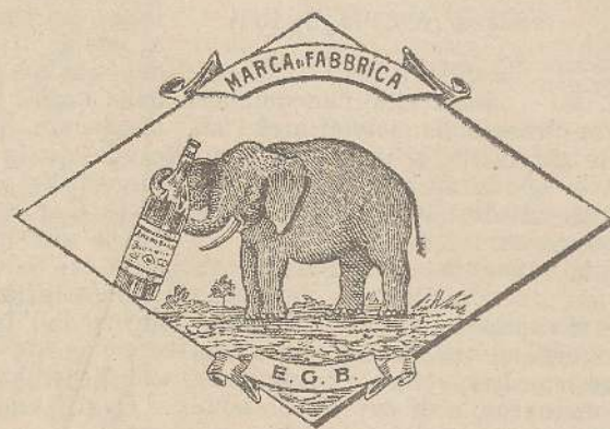
Marca speciale depositata.