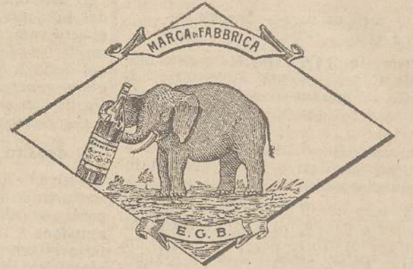
Marca speciale depositata.

Valenti autorità mediche lo dichiarano il più efficace ed il migliore ricostituente tonico digestivo dei preparati consimili, perchè la presenza del RABARBARO, oltre d'attivare una buona digestione, impedisce anche la stitichezza originata dal solo FERRO-CHINA.