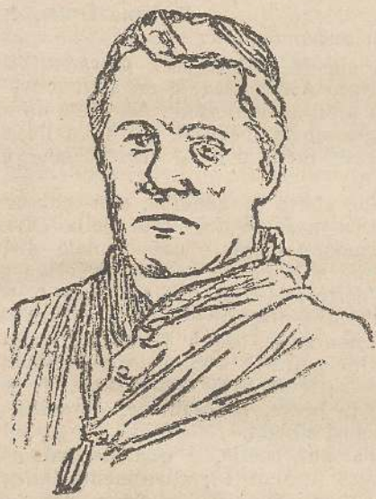
Pio X a Udine