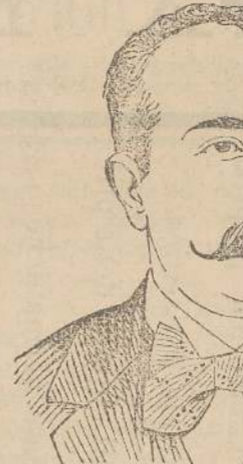
Napoli, 16 Gennaio 1903.

Nelle forme di dimagrimento dipendente da alterazioni del ricambio materiale, ottenuti col uso della Emulsione Scott dei risultati favorevolissimi. Gli stessi effetti ho potuto avere in parecchi casi di neurastenia nei quali gli infermi avevano in precedenza fatto uso inutilmente di altri preparati oggi in voga.