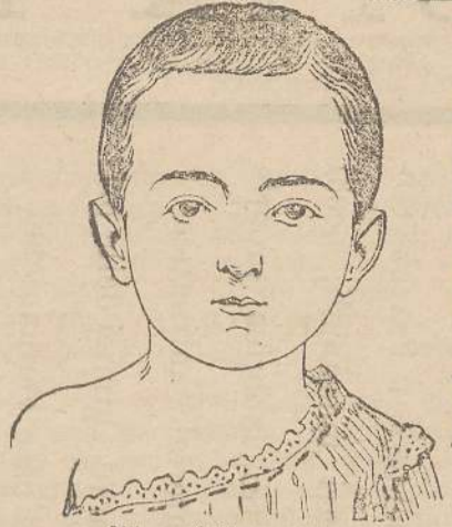
Milano, 5 Ottobre 1901.

Il mio bambino cresceva pallido, senza appetito e con le glandole molto ingrossate; la dentizione non si era ancora iniziata malgrado avesse quasi venti mesi. Prolissimo nelle gaminie, non poteva neppure reggersi in piedi. La cura della Emulsione Scott lo ha addirittura cambiato. Le sue gaminie si sono rinfiorate e lo reggono benissimo, gli marcano anche quattro denti senza disturbo alcuno e non ha più le glandole ingrossate. L'appetito ed il colore sono pure dei più promettenti. In vista di questi risultati il medico mi ha consigliato di estendere la cura anche ad una mia bambina trelocenne, sempre malaticcia e giunco un risveglio nell'appetito ed una maggiore vivacità.