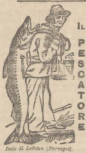
IL PESCATORE Isola di Lofoten (Norvegia).

Da molti anni la prima scelta dei merluzzi che si pescano nelle fredde acque delle isole di Lofoten in Norvegia, sono accaparrati per la produzione dell'olio di fegato destinato alla casa Scott & Bowne, Ltd., di Londra per la sua Emulsione.