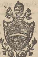
esclusivo fornitore del ss. palazzo Ap.

Fornisce concerti di qualunque numero di campane di ogni grandezza, peso, tono. Fonde campane in concerto con altre e garantisce i propri lavori per fattura, durata ed intonazione a giudizio di periti. Riceve campane vecchie in cambio, assume in costruzione degli armamenti e castelli per campane in ferro battuto, ghisa e legno a nuovo sistema con isolatori per ottenere maggior suono dalle campane e assumendone anche la riparazione e la posizione in opera assicurando