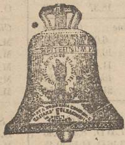
Schiarimenti e catalogo a richiesta

Padova - Daciano Colbacchini e Figli - Padova