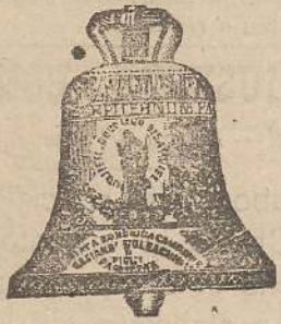
Schiarimenti e catalogo a richiesta

Padova - Daciano Colbacchini e Figli - Padova