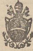
esclusivo fornitore dei ss. palazzi Ap.

Fornisce concerti di qualunque numero di campane di ogni grandezza, peso, tono. Fonde campane in concerto con altre e garantisce i propri lavori per fattura, durata ed intonazione a giudizio di periti. Riceve campane vecchie in cambio, assume in costruzione degli armamenti e castelli per campane in ferro battuto, ghisa e legno a nuovo sistema con isolatori per ottenere maggior suono dalle campane e assumendone anche la riparazione e la posizione in opera assicurando