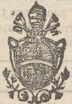
esclusivo fornitore del ss. palazzo Ap.

Fornisce concerti di qualunque numero di campane di ogni grandezza, peso, tono. Fonde campane in concerto con altre e garantisce i propri lavori per fattura, durata ed intonazione a giudizio di periti. Riceve campane vecchie in cambio, assume in costruzione degli aramenti e castelli per campane in ferro battuto, ghisa e legno a nuovo sistema con isolatori per ottenere maggior suono dalle campane e assumendone anche la riparazione e la posizione in opera assicurando