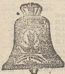
Schiarimenti e catalogo a richiesta

Padova - Daciano Colbacchini e Figli - Padova