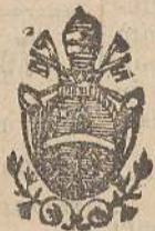
esclusivo fornitore dei ss. palazzi Ap.

Fornisce concerti di qualunque numero di campane di ogni grandezza, peso, tono. Fonde campane in concerto con altre e garantisce i propri lavori per fattura, durata ed intonazione a giudizio di periti. Riceve campane vecchie in cambio, assume in costruzione degli armamenti e castelli per campane in ferro battuto, ghisa e legno a nuovo sistema con isolatori per ottenere maggior suono dalle campane e assumendone anche la riparazione e la posizione in opera assicurando