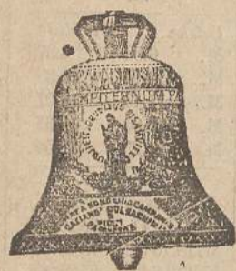
Schiarimenti e catalogo a richiesta

Padova - Daciano Colbacchini e Figli - Padova