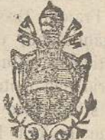
esclusivo fornitore del ss. palazzi Ap.

Fornisce concerti di qualunque numero di campane di ogni grandezza, peso, tono. Fonde campane in concerto con altre e garantisce i propri lavori per fattura, durata ed intonazione a giudizio di periti. Riceve campane vecchie in cambio, assume in costruzione degli armamenti e castelli per campane in ferro battuto, ghisa e legno a nuovo sistema con isolatori per ottenere maggior suono dalle campane e assumendone anche la riparazione e la posizione in opera assicurando