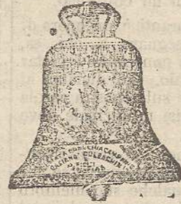
Schiarimenti e catalogo a richiesta

Padova - Daciano Colbacchini e Figli - Padova