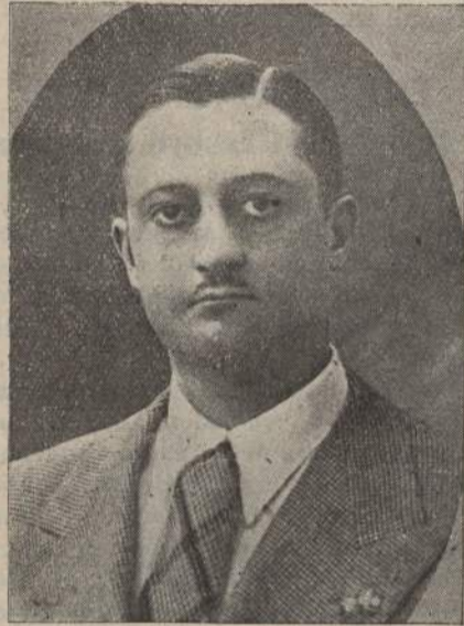
Il Presidente del Comitato ordinatore della Fiera Cavalli

La Fiera Cavalli di S. Giorgio che vantava in Friuli una vetusta tradizione, lasciata decadere nel periodo grigio dell'anteguerra e dell'immediato dopoguerra, ha avuto, sotto l'impulso del Regime fascista e dei suoi maggiori esponenti in questa nostra terra classicamente romana un graduale e notevole risveglio.