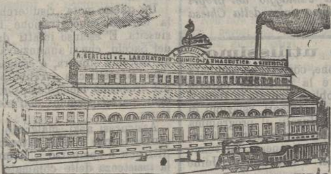
Stabilimento Chimico-Farmaceutico A. BERTELLI e C. - Milano

OLIO DI FEGATO DI MERLUZZO ALLA CATRAMINA (50%).