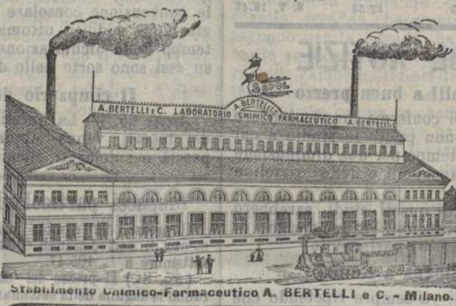
Stabilimento Chimico-Farmaceutico A. BERTELLI & C. - Milano.

Ben pochi rimedi hanno raggiunto la fama che godono le Pillole di Catramina Bertelli, perchè non è facile raggiungere quella purificazione di efficacia, senza di cui un medicinale, benché appoggiato con ogni mezzo di propaganda, non potrebbe avere rinomanza, né veridicità; mentre invece le Pillole di Catramina Bertelli, per i risultati innumerevoli che danno nelle affezioni qui sopra ricordate, sono il medicinale sempre più richiesto dal pubblico e più lodato dai Medici. — Le Pillole di Catramina furono premiate con la grande medaglia d'oro alle Esposizioni: MILANO 1891, PAVIA 1897, BRESCIA 1898, VIENNA 1898, BARCELONA 1888, COLONIA 1893, EDIMBURGO 1893, BRUXELLES 1895, con l'unico premio rilasciato alle specialità medicinali d'ogni nazione all'estero. — Una grossa scatola Pillole di Catramina L. 2,50, più 50 cent. se per posta, 4 scatole L. 2,50. — Scatole e medicine in Italia e per posta da L. 1,10. — Distribuiti da A. Bertelli & C., Milano, Via Paolo Frisi, 28.