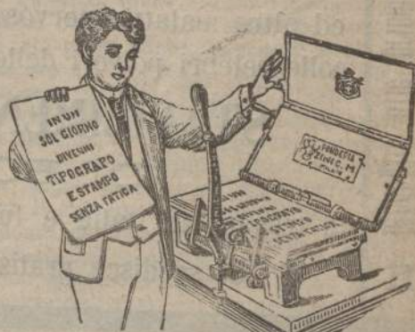
(Vedasi annuncio in quart. pagina).

— Macchine da stampa da ogni prezzo — ZINI C. M. — MILANO