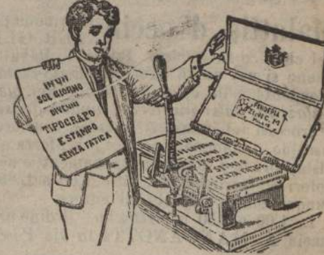
(Vedasi annuncio in quarta pagina).

Novità in articoli per stampare da sé — Macchine da stampa da ogni prezzo — ZINI C. M. — MILANO