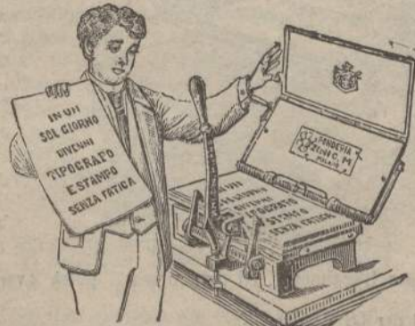
(Vedasi annuncio in quarta pagina).

Novità in articoli per stampare da sé — Macchine da stampa da ogni prezzo — ZINI C. M. — MILANO