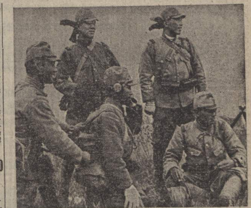
Genieri telefonisti nipponici del Corpo di Spedizione in Cina collaudano una linea appena impiantata

Più ancora dei danni materiali causati nelle due isole delle Hawaii è importantissimo il significato della manifestazione navale nipponica. Ciò dimostra come la Marina giapponese non soltanto domini il Pacifico occidentale - dei che nessuno, neanche gli americani, ha mai dubitato (i nipponici dispon-