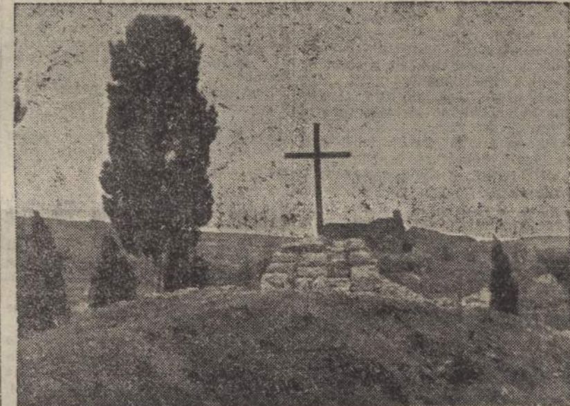
Visioni di latifondo...

Sono molteplici e tutte di grande importanza le cause che hanno portato alla formazione del latifondo; ma in ognuna d'esse bisogna nettamente distinguere ciò che è dovuto alla materia e ciò che è dovuto all'uomo; poiché, come ben defini Mussolini, il latifondo è principalmente « un male morale ». Certo che in ognuna delle piccole cause e concasse formanti i fattori essenziali alla comprensione