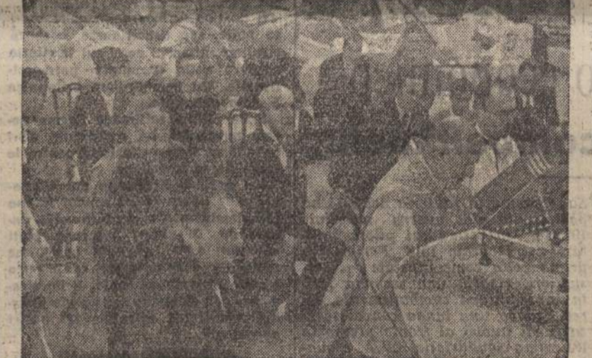
L'eminentissimo Card. Gerlier, Arcivescovo di Lione e Primate delle Gallie, celebra la Messa tra le rovine gloriose dell'Alcazar di Toledo. Dietro il celebrante l'Amministratore Apostolico di Toledo e l'Ambasciatore di Francia a Madrid