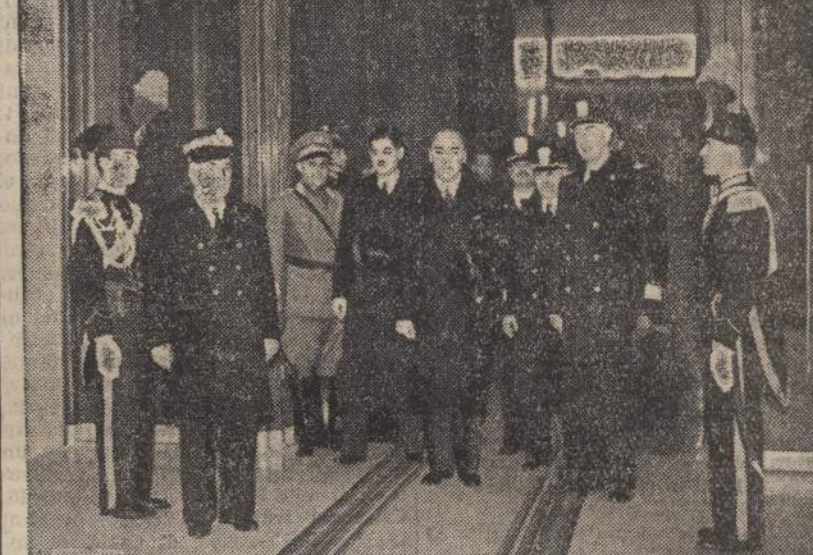
La partenza da Roma del Ministro delle Finanze ungherese

RAIMONDO MANZINI Direttore responsabile Società Anonima L'Avvenire d'Italia Stabilimento Tipografico