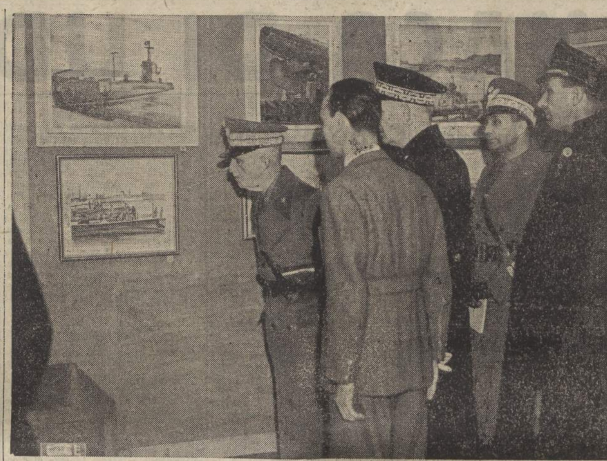
ROMA - La Maestà del Re Imperatore visita alla Galleria di Roma la mostra d'arte marinara di guerra

Altri contingenti portoghesi partiti per lo Azzorre LISBONA, 17. Continuano le partenze di contingenti di truppe per lo Azzorre, in primo luogo per l'Arcipelago di Capodoverde e per Madera. Si apprende che reparti organici di tali truppe vengono fatti proseguire per altre Colonie Portoghesi, evitando di rendere pubbliche tali misure per ragioni tanto interne che internazionali. Vari reparti sono già sbarcati nella Guinea Portoghesa, nell'Isola di San Tomé e all'Angola, che costituiscono i possedimenti che sarebbero più direttamente minacciati da una azione Nordamericana in Africa. (Radiostefani).