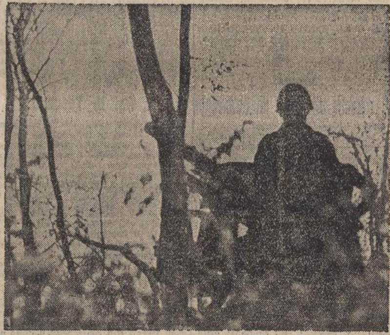
Una nostra postazione di artiglieria sulla riva di un fiume in Russia