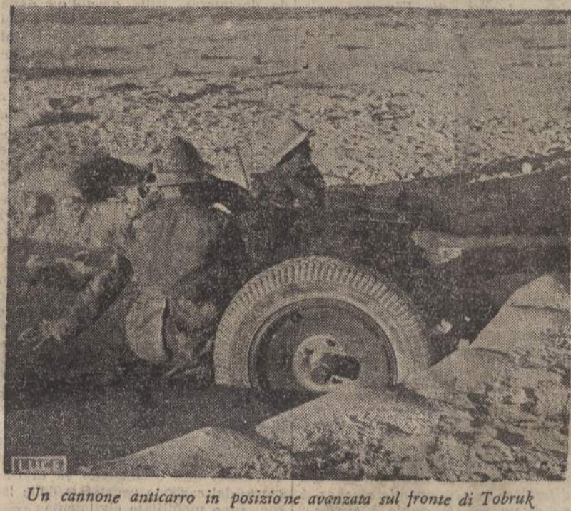
Un cannone anticarro in posizione avanzata sul fronte di Tobruk

Durante un'incursione su Derna la nostra caccia ha abbattuto un bombardiere nemico. (Stefani).