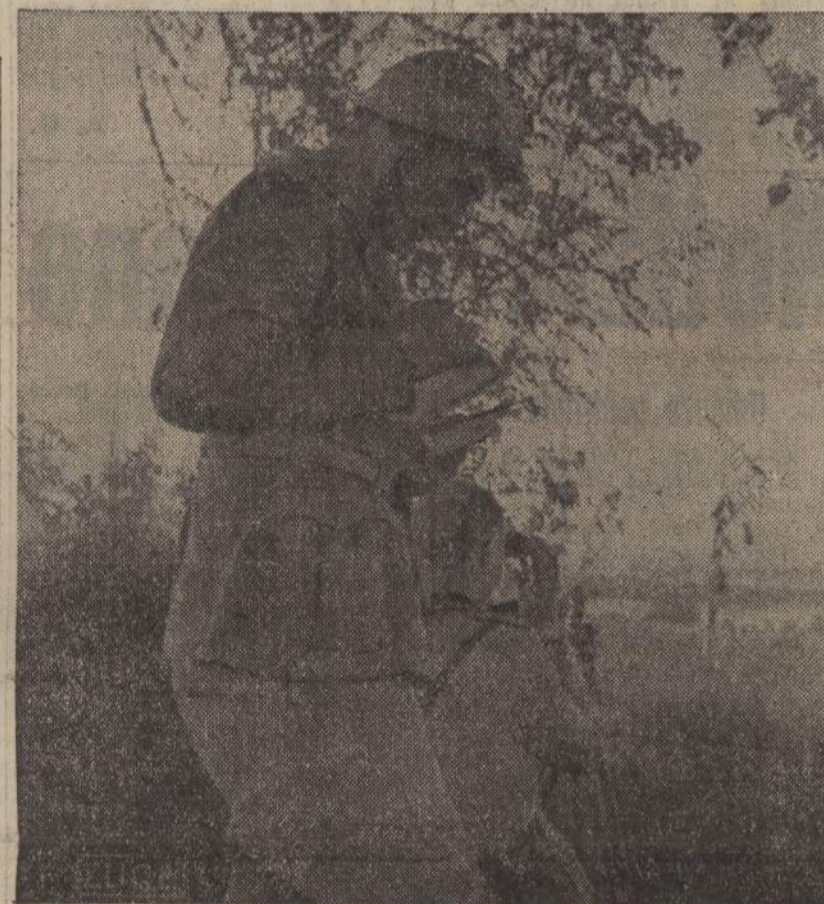
Sul fronte russo. Gli addetti ad una nostra batteria studiano il puntamento dei pezzi presso un fiume

LISBONA, 10 Un piroscafo spagnolo ha sbarcato a Capo Verde 17 superstiti del piroscafo inglese "Singales Prince" silurato sulla linea dell'equatore il 10 settembre. Si ignora il destino di altri 57 uomini che componevano l'equipaggio.