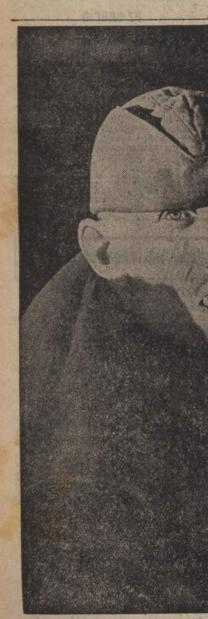
Prigioniero sovietico in un campo tedesco