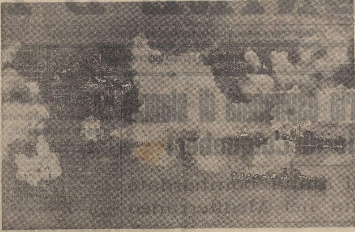
Unità della Marina svedese che affondano per scoppi a bordo