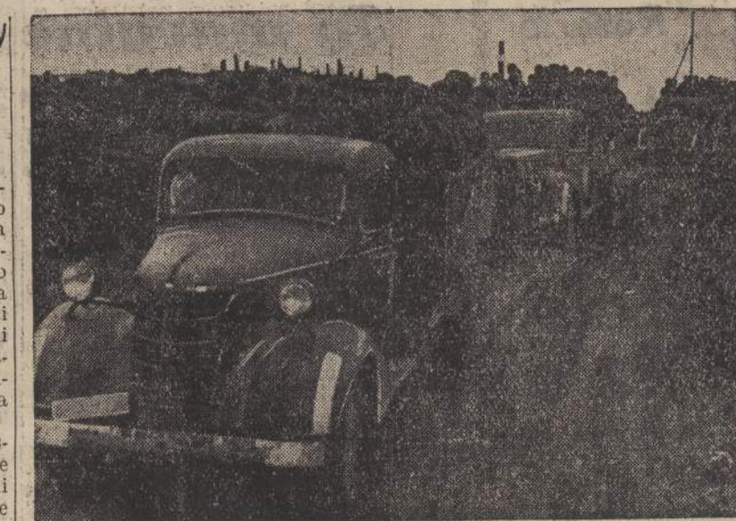
La marcia nella Carelia Orientale