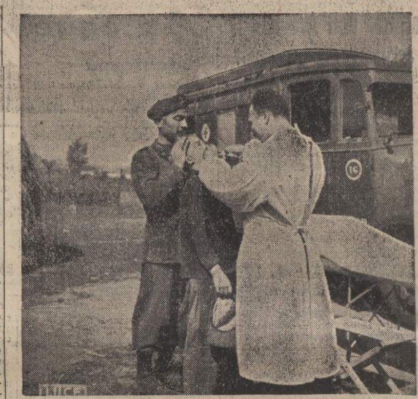
Corpo di Spedizione Italiano in Russia. Assistenza sanitaria alla popolazione di un villaggio

AOSTA, 23 sera. L'ascensione di 30 giovani fascisti della GIL, che in pieno assetto di guerra, hanno scalato domenica il massiccio del Gran Paradiso, si è svolta con la massima regolarità e senza incidenti. All'alba i giovani, suddivisi in 70 cordate, hanno iniziata la scalata verso la vetta del massiccio, che è uno dei più alti e maestosi d'Europa. Raggiunta la vetta, i giovani hanno innestato la bandiera ed hanno reso omaggio ai gloriosi Caduti. Questa una delle imprese veramente degne di rilievo, poiché si tratta di una ascensione di oltre 4000 mila metri di altitudine, effettuata da giovani sotto i 20 anni. Il dislivello superato in tre giorni di marcia raggiunge i 7000 metri con 60 chilometri di strade mullatiere percostrite.