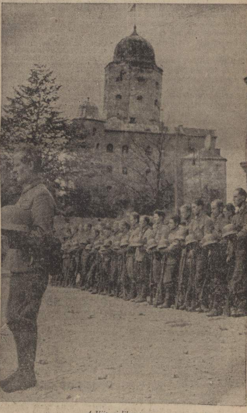
A Viipuri liberata. Le truppe finlandesi assistono ad una funzione religiosa