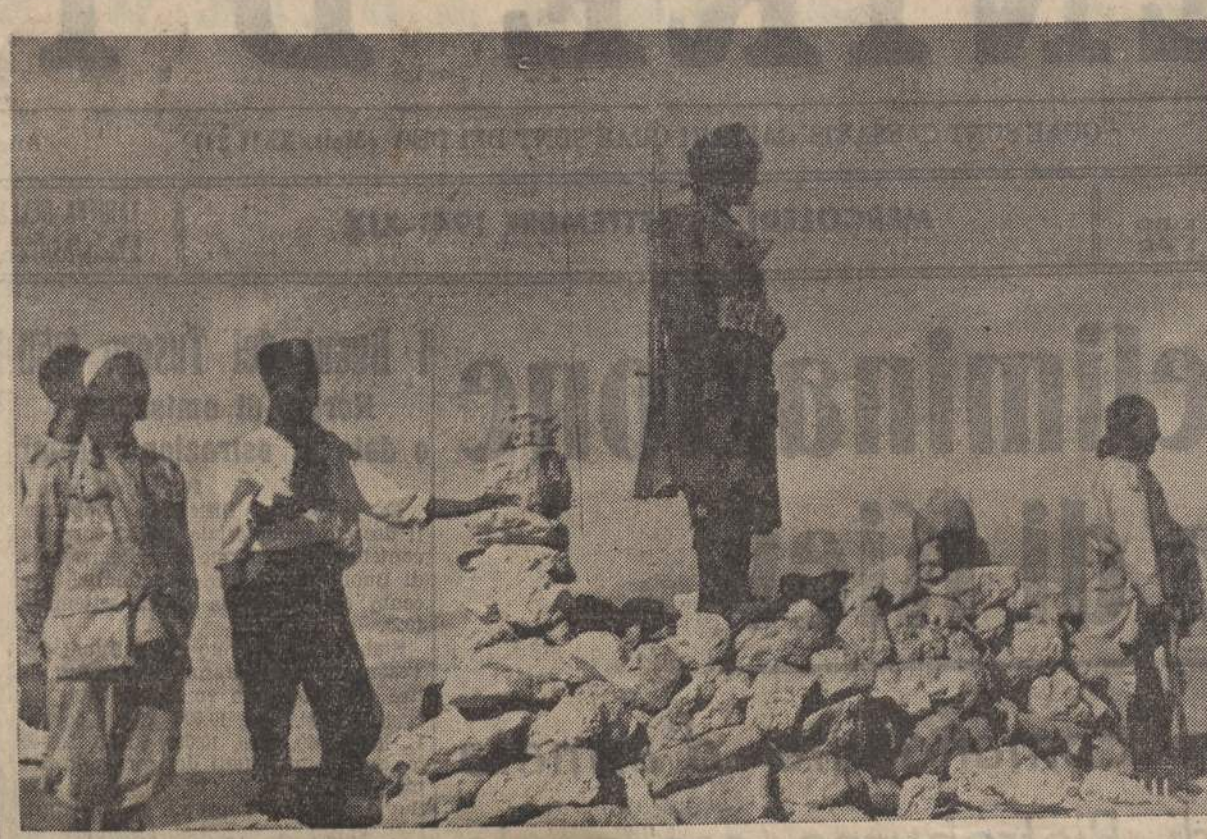
A sud di Sollum, oltre il confine egiziano. Fedeli sentinelle indigene nel deserto