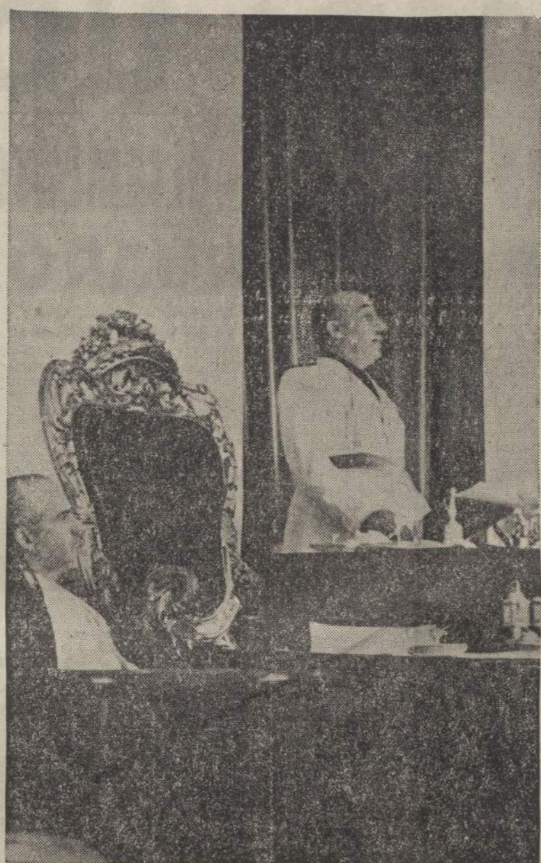
Il Generalissimo Franco pronuncia il suo discorso durante la seduta del Consiglio Nazionale della Falange. A sinistra Serrano Suner.