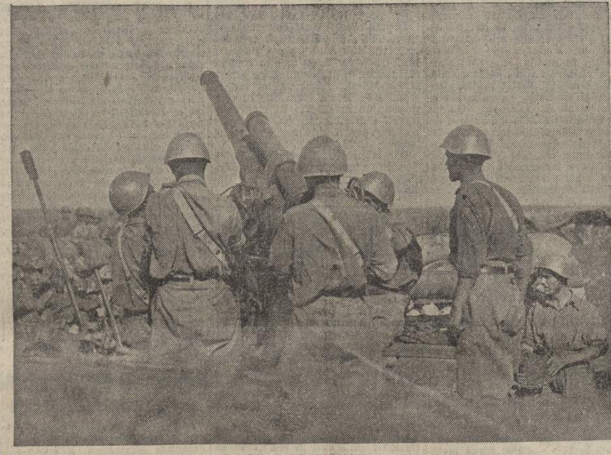
La vigile sorveglianza della nostra artiglieria costiera sui punti di collisione

Del Fueshrer è stato decorato per le azioni di Spagna della Gran Croce dell'Aquila tedesca con spade. Il generale Bastico è inoltre molto noto negli ambienti nazionali ed esteri per le sue particolari doti di studioso e di scrittore in questioni militari. Oltre ad una lunga serie di articoli e di saggi vari apparso nei più importanti giornali e periodici, egli ha pubblicato, un'opera in tre volumi, "L'evoluzione dell'arte della guerra" , che costituisce ancor oggi il testo raccomandato per la preparazione alle prove di ammissione all'Istituto superiore di guerra ed è stata integralmente tradotta in varie lingue straniere per iniziativa delle autorità militari di diverse nazionalità estere.