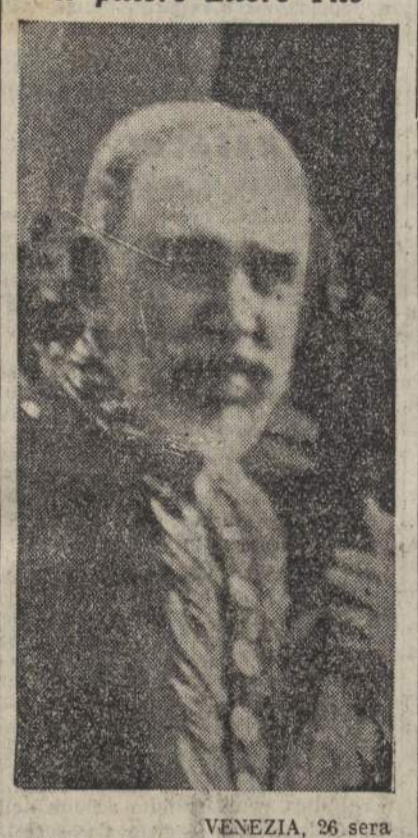
VENEZIA, 26 sera. L'Accademico d'Italia Ettore Tito, pittore illustre, è morto stamane, nella sua abitazione. Con la morte di Ettore Tito, l'Italia perde un suo ingegno figlio, universalmente ritenuto come uno dei più grandi pittori contemporanei. Nato a Castellamare di Stabia, nel 1850 dall'età di otto anni ha vissuto sempre a Venezia, presso la cui Accademia di Belle Arti, pur non avendo raggiunto l'età prescritta, fu ammessa grazie alle sue particolari attitudini.

Oltre le rive del Prut — il cui corso divide la Moldavia dalla Bessarabia e che dopo la recente rapina sovietica era diventato linea di assurdo confine tra U. R. S. S. e Romania — arde la guerra. Varcata d'impeto la gonfia vena d'acqua, già incontrata alle divisioni tedesco-romene muovono le tormentate popolazioni che hanno conosciuto il terrore rosso: i campanelli degli storici santuari e monasteri ortodossi sono muti perché i sacri bronzi sono stati asportati dai «senza Dio», ma alla voce muta dei campanelli supplisce il grido e il pianto delle popolazioni superstiti che ritrovano la Patria perduta. La linea di marcia è in movimento dai Carpazi, e cioè dalla Bucovina (anche questa, come è noto, in gran parte rapinata dallo Zar rosso) al litorale del Mar Nero. Cernauzi è la principale città della Bucovina con circa 112 mila abitanti sulla grande strada commerciale verso la Polonia. Durante la dominazione austriaca ebbe grande importanza essendo la più orientale delle città dell'Impero austriaco. Nel 1875 vi fu istituita una Università in cui ebbe grande rinomanza la Facoltà di Teologia. La Bucovina è la terra classica dei monasteri romeni che furono, nel tempo, la cui Accademia di Belle Arti, pur non avendo raggiunto l'età prescritta, fu ammessa grazie alle sue particolari attitudini.